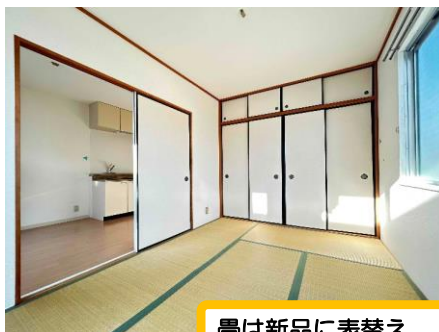
畳は新品に表替え