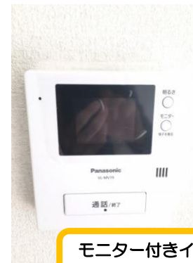
モニター付きインターフォン